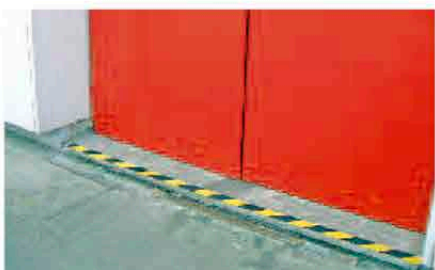
Escalones en salidas de emergencia